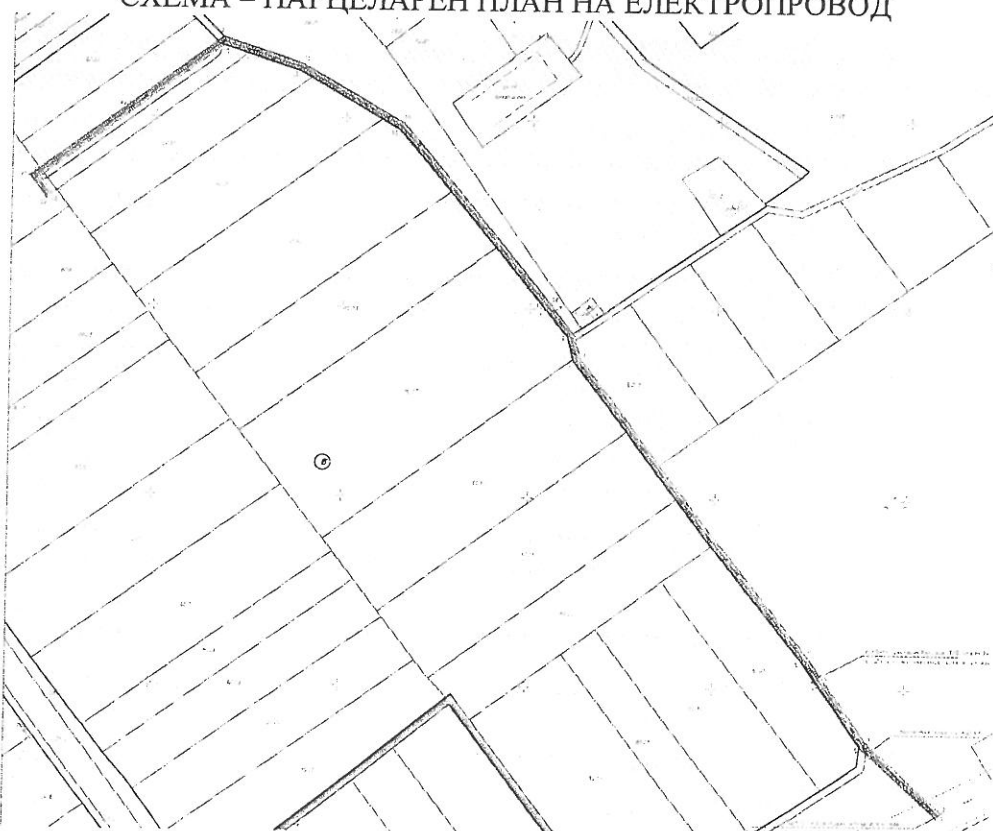
СХЕМА – ПАРЦЕЛАРЕН ПЛАН НА ЕЛЕКТРОПРОВОД

Електроснабдяването ще се извърши ст.р. стълб в гръбнака на ВЕ „Ботуня”-20 kV, разположен в имот № 000242-собственост на Община Криводол. От него с подземна кабелна линия в сервитута на Общински път №000647 имот № 060013 – собственост на възложителя ще се захрани трафопост 20/4kV, по указанията на дадени с писмо № 1202187591 от 20.05.2016г. на „ЧЕЗ Разпределение България” АД.